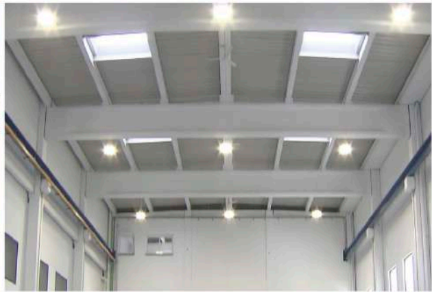
Nau industrial MIF, Vic. Sunoptics més Haloprism de Carandini.