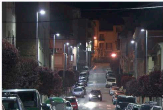
Il·luminació viària Centelles. Lluminiària V-MAX de Carandini.