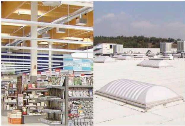
Hipermercat Esclat, Malla. Claraboies Sunoptics.