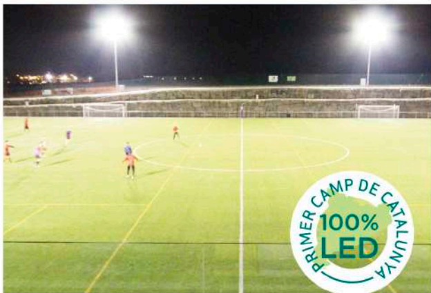
Camp de futbol de Gurb. Il·luminació T-MAX de Carandini.